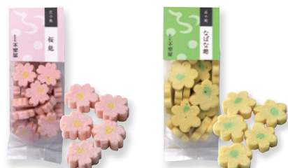
桜麩 (6g入) なばな麩 (5g入)

お料理に小さな花が咲くように愛らしさを添える「彩り麩」。春は「桜」「なばな」がおすすめです。