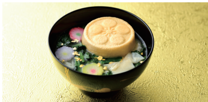
金の宝の麩:(友禅菊麩、金箔、湯葉、ほうれん草)のおすまし